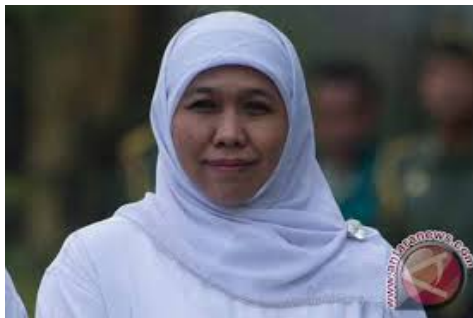
Menteri Sosial Khofifah Indar Parawansa

[JAKARTA] Menteri Sosial Khofifah Indar Parawansa mengatakan dialog regional untuk membahas kebutuhan difabel dalam pemilu dapat mendorong pemerintah lebih memerhatikan kesetaraan hak penyandang disabilitas dalam bidang politik.